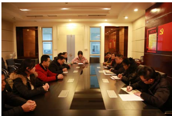
节前困难职工慰问活动

二是经常开展扶危济困活动。当中心或相关单位的员工及其家属罹患疾病或遭遇家庭不幸时，中心都及时组织看望或捐赠活动帮助其尽快走出困境。