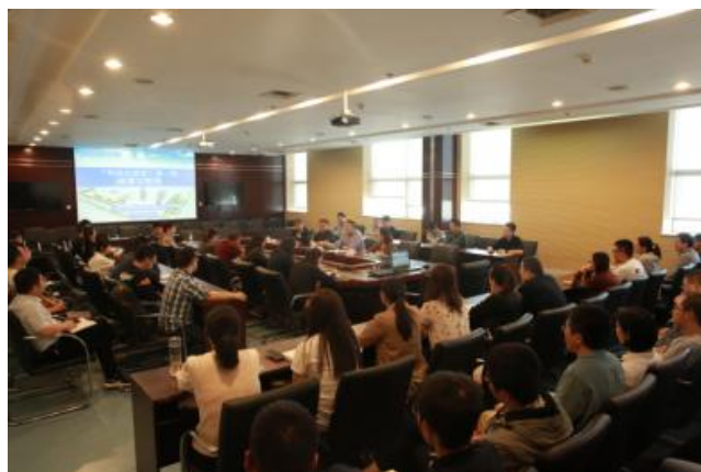
中心干部、职工部分培训现场

中心十分重视自身的科研开发和技术创新能力的建设，在不断拓展检验领域、开发检验项目的同时，有目的的培养既能冲在检验第一线又能承担科研课题研究的高素质专业技术人员。