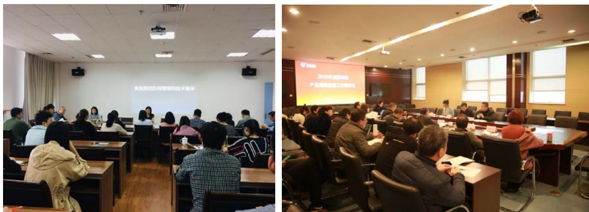
产品质量管理和技术培训会（左）、产品质量监管研讨会（右）