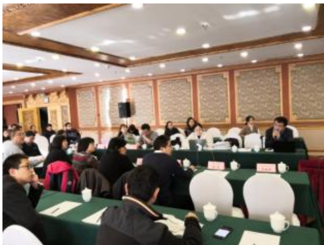
国家监督抽查任务评审现场

为牵头机构。此次国抽工作时间紧、任务重、区域跨度大，工业品和食品相关产品国抽同时开展也增加了抽查任务的复杂性。在公司领导的统一部署下，中心内部统筹安排、合理分工，在抽样、检测、汇总上报等各个环节紧密配合，严格按照各项任务的方案执行。在工作进度、检验、应急事件处置等方面与总局产品负责人、行业技术专家、技术机构及时沟通交流，高质量地完成了国家监督抽查任务。中心牵头的复合膜袋产品国家监督抽查任务受到各个参与机构、现场评审专家及总局领导的充分肯定。