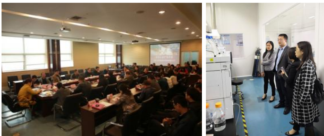
实验室资质认定扩项评审