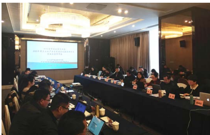
产品质量安全风险监测和预警评估评审

任的基石。中心充分发挥自身优势，以真诚守信的态度平等对待每一个客户，不因企业规模等因素对企业采取歧视态度。中心建立了申诉、投诉和争议处理程序，对发生的每一起申投诉案例均认真对待，独立客观的实施调查和处理并及时回复。通过以上措施中心树立了科学、规范、严谨和负责任的检验机构形象，赢得了社会的信任，维护了检验的有效性和公信力。