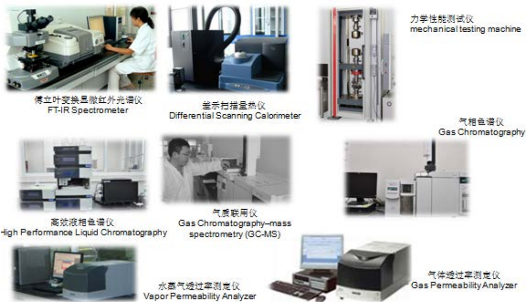
实验室部分检测设备