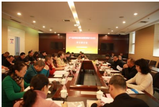
产品标准宣贯会（左）、监督检查学习研讨会（右）